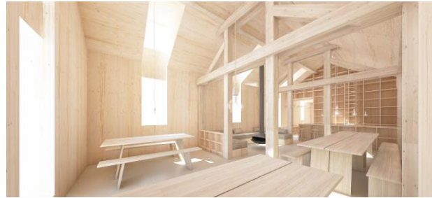
© Ludovic Schober - Dipl.-ing. univ. architecte SIA

La cabane est respectueuse de l'environnement . Elle utilise les énergies renouvelables et traite ses déchets. Cependant, une optimisation de ces énergies et de ces infrastructures est souhaitée.